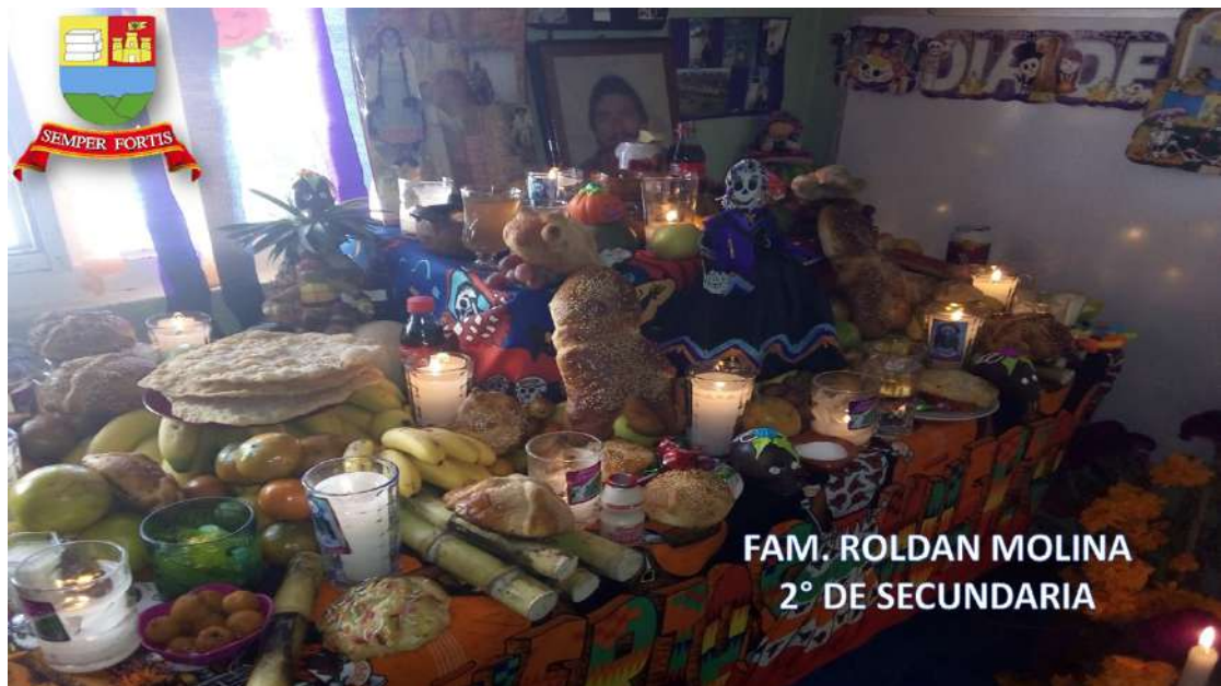
FAM. ROLDAN MOLINA 2° DE SECUNDARIA

Les compartimos algunos de los altares del día de muertos que nuestros alumnos realizaron en sus casas, para recordar a los que se nos adelantaron.