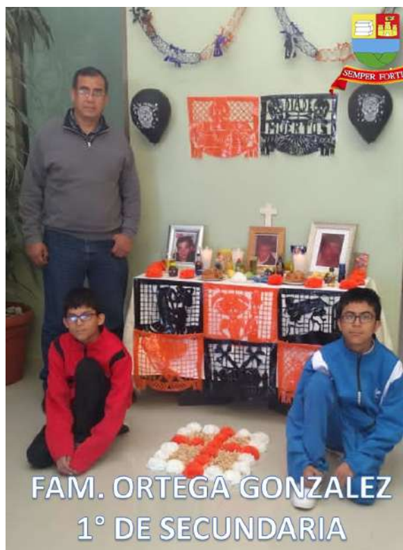
FAM. ORTEGA GONZALEZ 1° DE SECUNDARIA