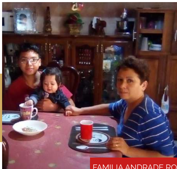
FAMILIA ANDRADE ROJAS

Me siento orgullosa por tener a mi hijo en esa escuela ya que ha aprendido muchas cosas y me doy cuenta que cada día mejora más en el aspecto personal , académico, formativo y humano”.