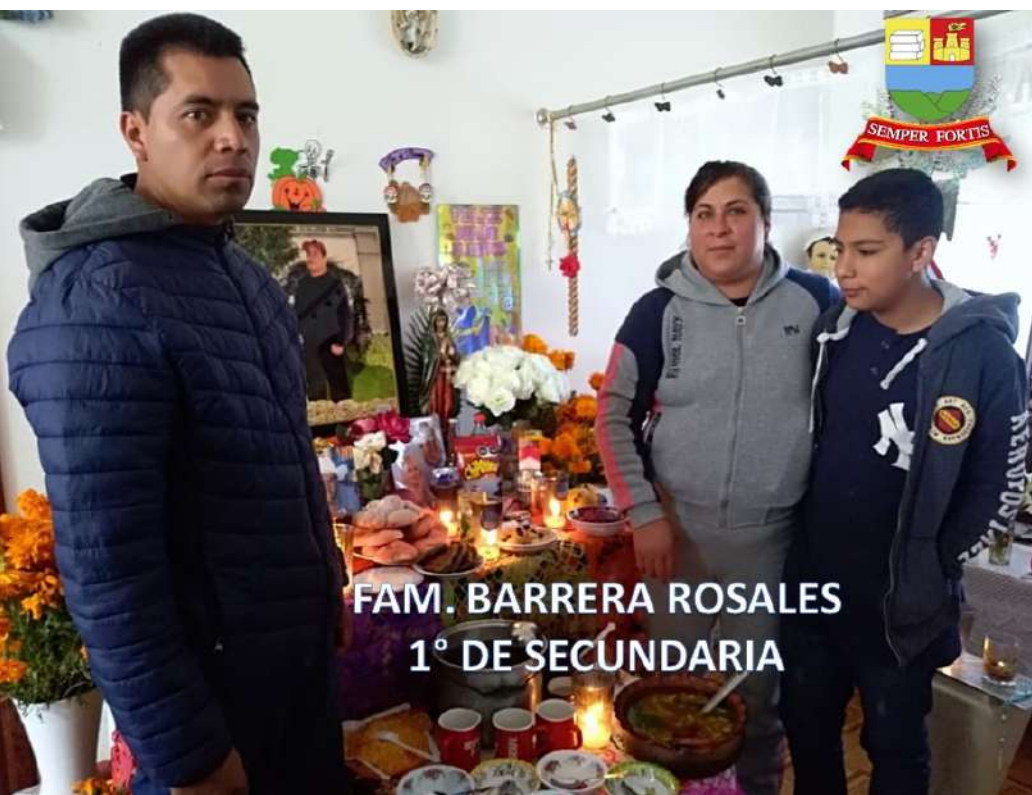
FAM. BARRERA ROSALES 1° DE SECUNDARIA