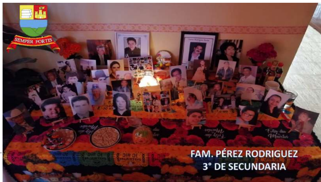
FAM. PÉREZ RODRIGUEZ 3° DE SECUNDARIA