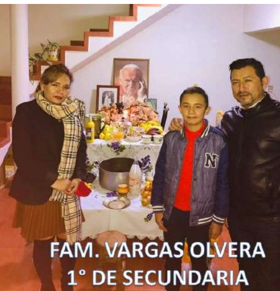
FAM. VARGAS OLVERA 1° DE SECUNDARIA